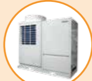
シングルエース 外気処理仕様