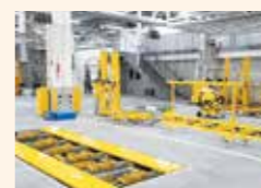
フレーム修正機スパネージ