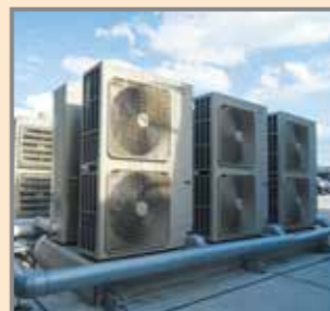
設備用パッケージエアコン室外機