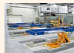
フレーム修正機カラライナー