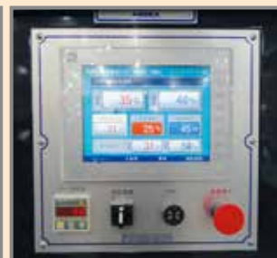
塗装ブース制御コントローラー