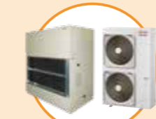
設備用パッケージエアコン 外気処理仕様