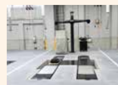
アライメントテスター